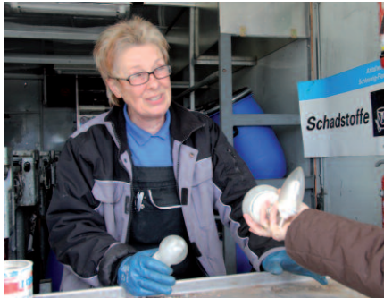
Unser fachkundiges Personal nimmt Ihre Schadstoffe gern entgegen.

Weil Chemikalien, viele Reinigungsmittel, Energiesparlampen usw. bei nicht sachgemäßer Entsorgung eine ernste Gefahr für unsere Umwelt darstellen, machen wir Ihnen die sichere Entsorgung so bequem wie möglich – und das seit 20 Jahren!