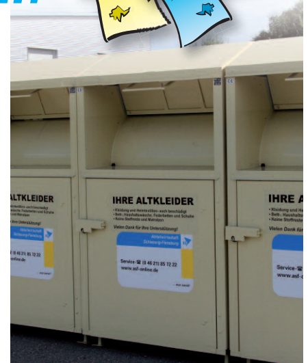
Kreisweit für Sie vor Ort: Die ASF-Depotcontainer.