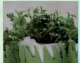
Tag 5: Juchhu, da sind sie!