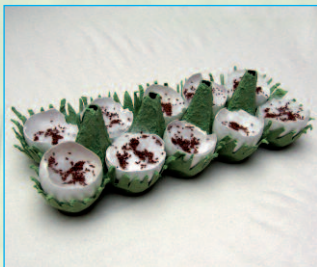
So könnte euer kleiner vorbereiteter Kressergarten aussehen.