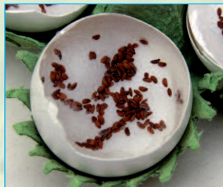
Tag 1: Jetzt wird's spannend ...