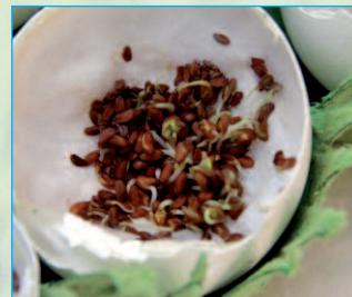
Tag 3: Bald brechen die Samen auf ...